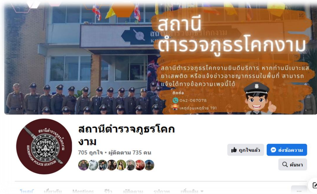
FaceBook สภ.โคกงาม