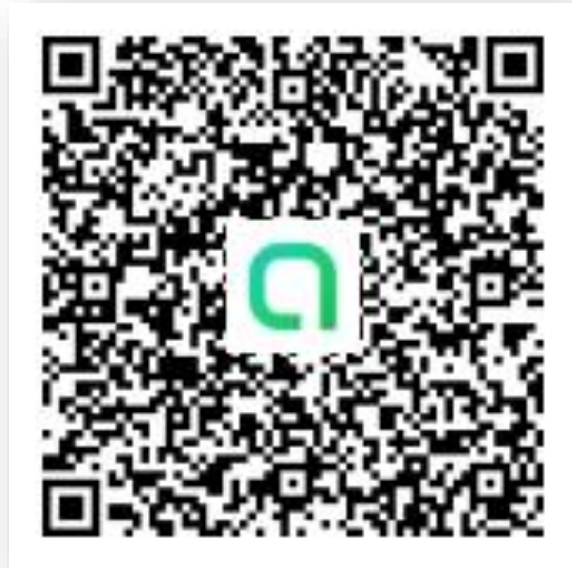
LINE แจ้งเหตุ สภ.โคกงาม